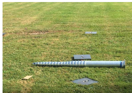
Neues Verankerungssystem erspart ein Fundament