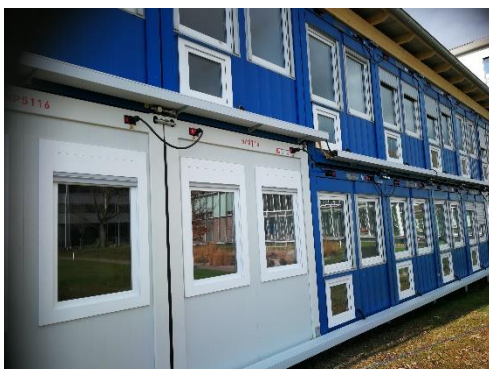
Neues System Vermeidung eines Fundaments